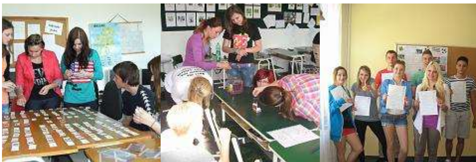
Projektový den - další fotografie ...