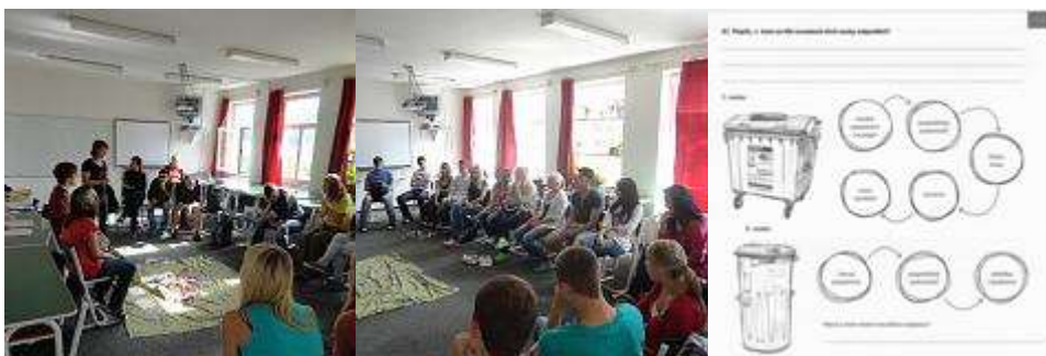
Fotogalerie ... , Materiály k programu ke stažení (.pdf) ... , Více informací ...

Jaký je osud odpadu? Jaký vliv má odpad na životní prostředí a jakou roli má v tomto koloběhu člověk? Studenti 1. a 2. ročníku se seznámili s významem pravidla 3R (redukce, reuse, recyklace) , zhodnotili jednotlivé druhy odpadů z hlediska náročnosti na zdrojový materiál, spotřeby vody a energie při jeho výrobě a hledali ten nejšetrnější způsob k přírodě .